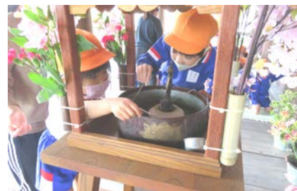
5歳児 花まつり (大寺)