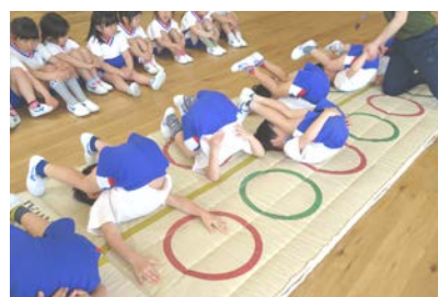
4歳児カワイ体操教室 「ささぶね」のポーズ!

もうすぐ端午の節句、保育園では年齢にあった鯉のぼりの製作に取り組み、それぞれかわいらしい鯉のぼりができました。子どもたちが鯉のようにたくましく元気に成長してほしいと願っています。