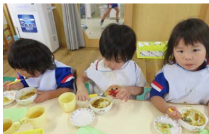
みんなで食べる給食は おいしいね♪